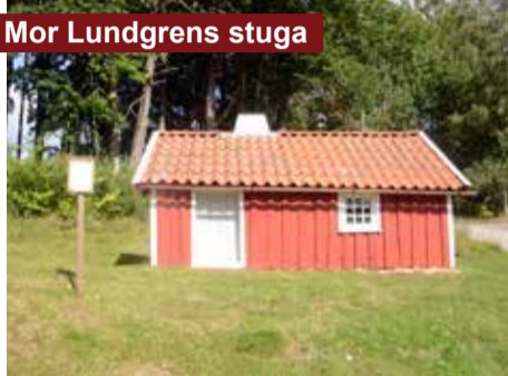
Mor Lundgrens stuga

Stenen har flyttats ut till vägen från sin tidigare plats ute i åkern, där man vid en undersökning hittade en gammal boplats. Resta stenar eller bautastenar brukar dateras till järnåldern.