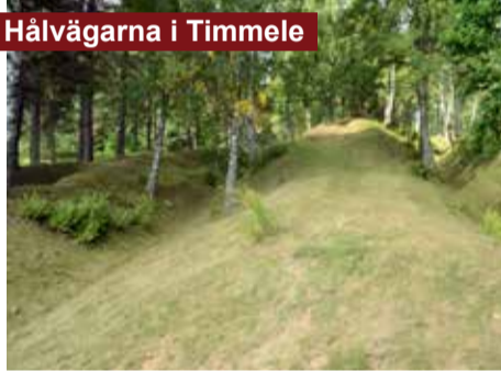
Hålvägarna i Timmele