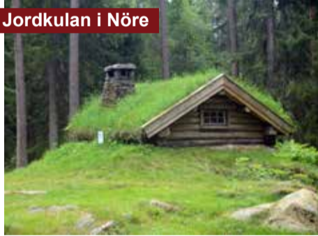
Jordkulan i Nöre

Gästgiveri har funnits här sedan 1600-tal eller tidigare och fram till 1907. Här var en viktig knutpunkt, då flera vägar strålade samman vid vadstället över Åtran. Byggnaden från slutet av 1700-talet har restaurerats av Timmele Hembygdsförening. Här finns samlingslokal, museisamlingar och en örtagård.