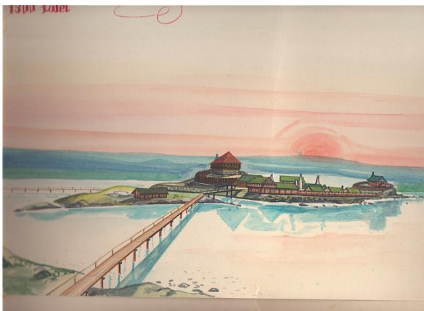
Rekonstruktionsbild av Jörgen Jensen. Stenhuset på höjden, bostadshuset längst ut till höger.

2014 gjordes en arkeologisk undersökning i närheten av Vädersholm med målet att lokalisera borgen Fagranäs . Forskningsgrävningen som genomfördes av arkeologer från Lödöse museum, planeras få en fortsättning under 2015.