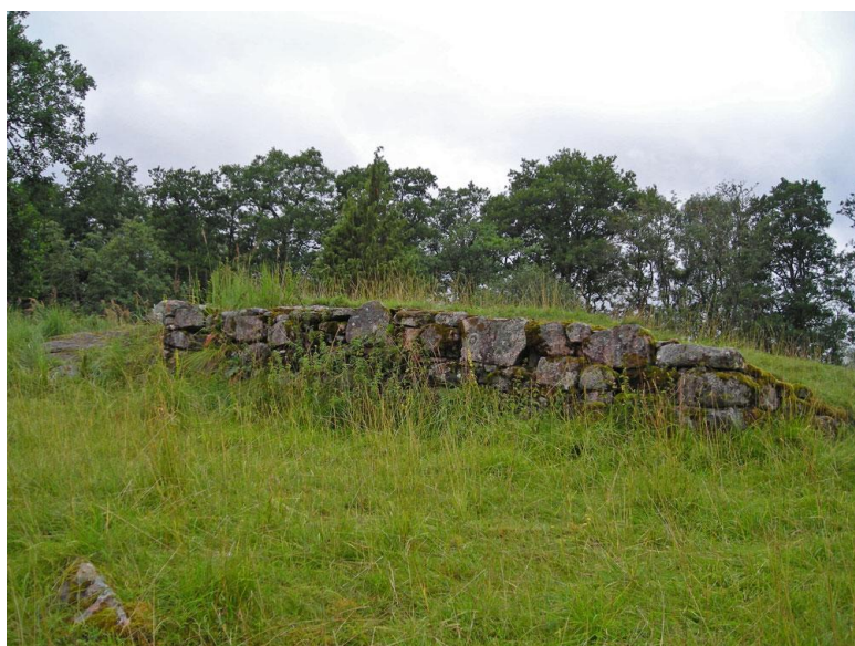
Murverk som tillhört grunden till stenhuset på Vädersholm.

Den höga byggnaden på rekonstruktionsbilden ovan är ett förslag till hur stenhuset, själva befästningen på gården, kan ha sett ut. På fotot nedan kan Du se vad som är kvar idag av detta kvadratiska torn.