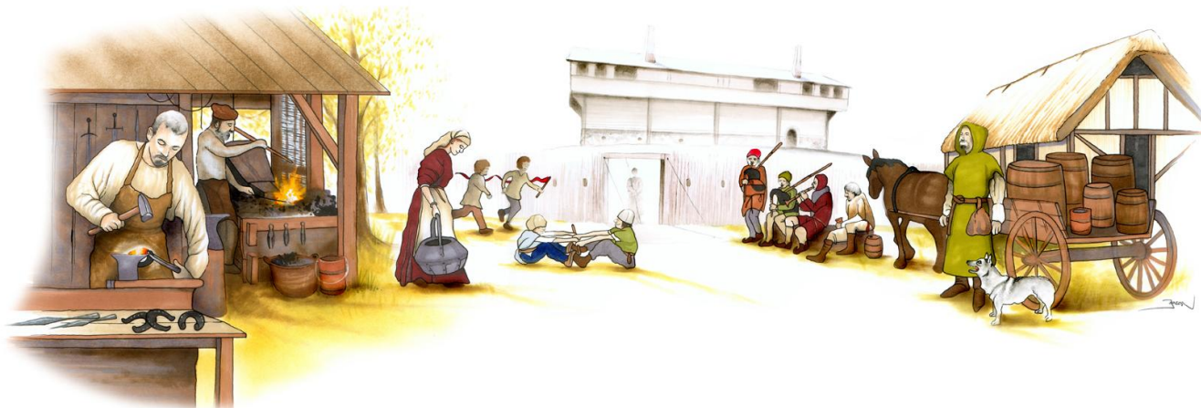
En dag på Vädershholm. Bild av Kristian Jensen.

Borgen var som ett litet samhälle för sig. Innanför muren fanns förutom soldater bl.a. hantverkare av olika slag. Meningen var att man skulle klara sig länge härinne om borgen utsattes för belägring.