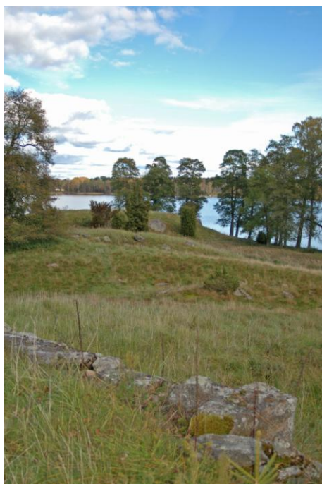
Yttre delen av borgudden.