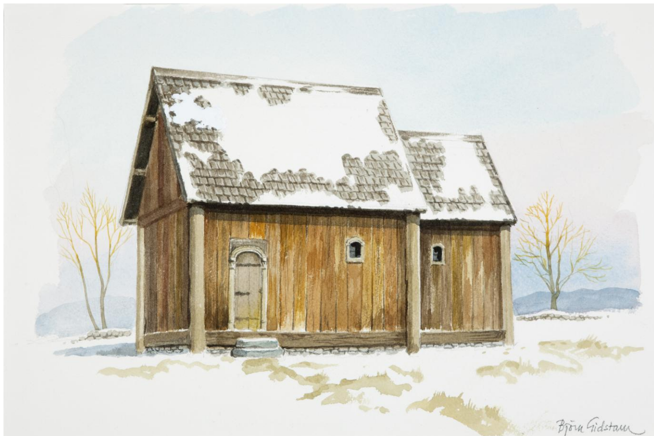
Rekonstruktionsbild: Björn Gidstam

På en skifteskarta över Säms by från 1710, kan man se att det ett par hundra meter från den medeltida kyrkoruinen i Södra Säm, finns en rektangulär markering och en förklarande text: "En gammal förfallen kyrkiogård".