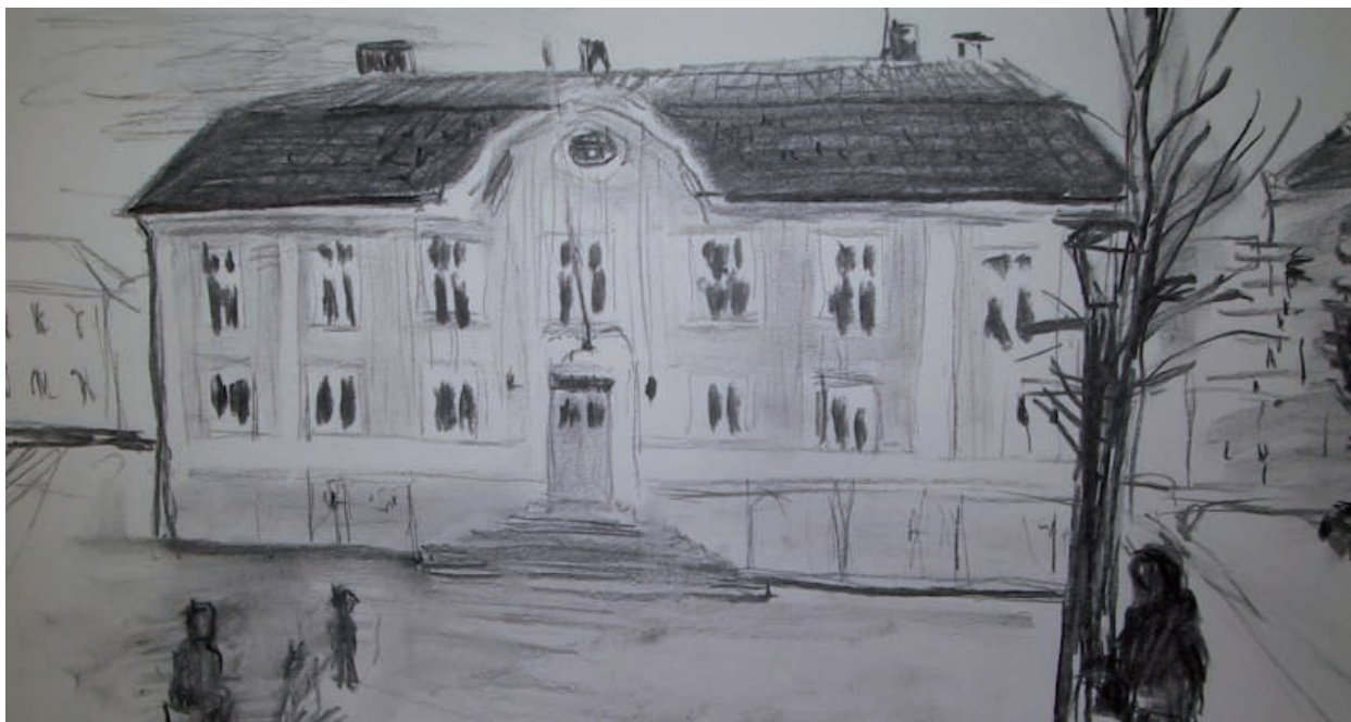
Teckning av Peter Waldenström