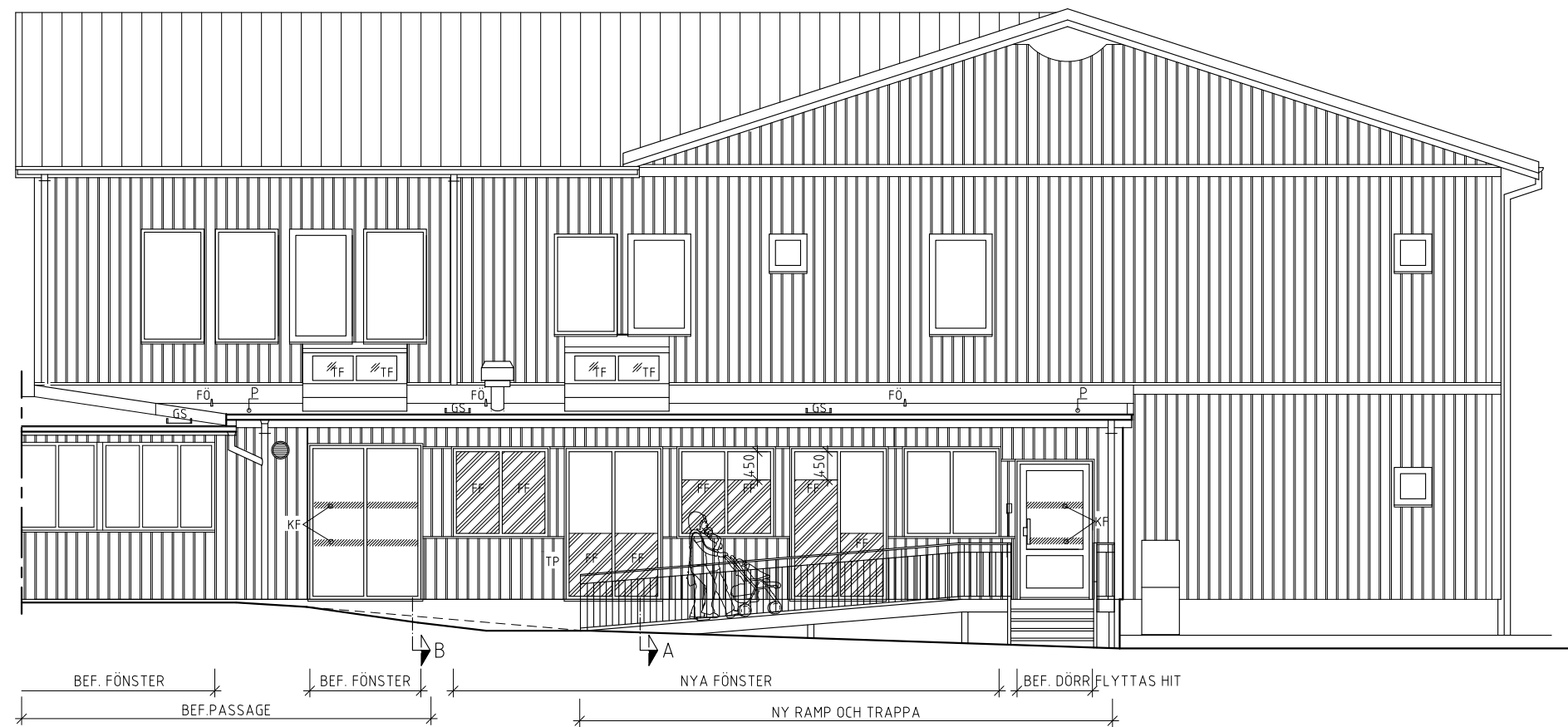
FASAD MOT NORDOST