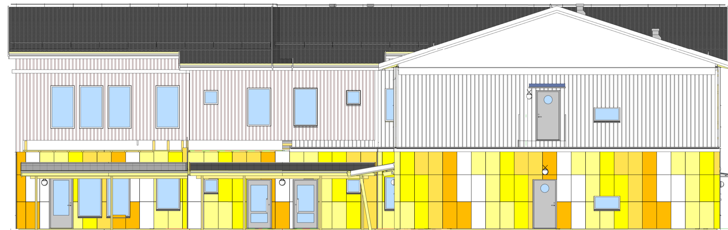
FASAD MOT SYD SKALA: 1 : 100