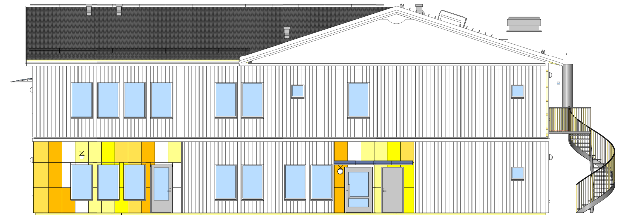
FASAD MOT OST SKALA: 1 : 100